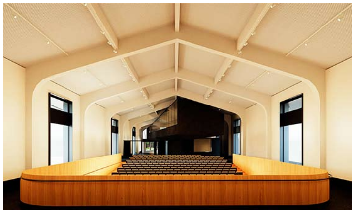
El presupuesto permitirá ejecutar las obras del futuro Museo Regional de Ñuble en el Barrio Ultraestación.