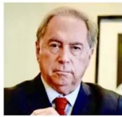
JUAN GABRIEL VALDÉS (77):

Político, jurista y diplomático, es el actual ministro de Relaciones Exteriores. Nacido en Amsterdam, llegó a Chile a los dos años. En su carrera ha sido subsecretario de Relaciones Exteriores, agente del Estado de Chile ante la Corte Internacional de Justicia en la demanda de Perú y embajador en Bélgica, Luxemburgo y la Unión Europea. Su destacada trayectoria combina el servicio público con una sólida carrera académica, siendo Profesor Titular del Instituto de Estudios Internacionales y de la Facultad de Derecho de la Universidad de Chile.