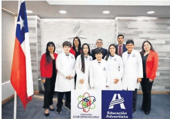
LOS ESTUDIANTES DEL COLEGIO ADVENTISTA PARTICIPARON EN EL CONGRESO EN MÉXICO.

Los estudiantes presentaron en México sus proyectos científicos jóvenes de todo el mundo.