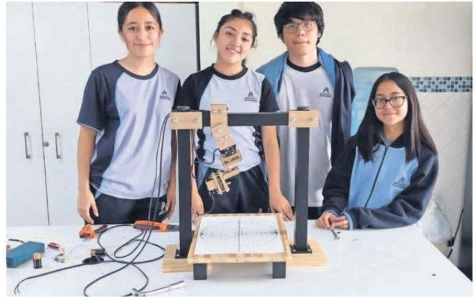
EN EL CONGRESO PRESENTARON SUS PROYECTOS A OTROS JÓVENES CIENTÍFICOS.

Este proyecto destaca por su uso de una plataforma ecuatorial invertida, una herramienta astronó-