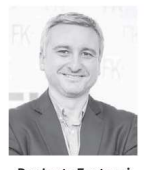
Por Jorge Fantuzzi Economista