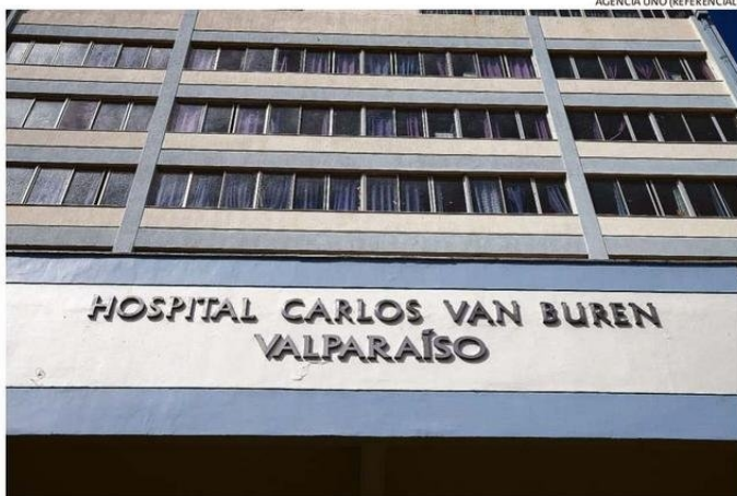
HOSPITAL ASEGURÓ QUE MÉDICOS TOMARON LICENCIAS Y PERMISOS DURANTE ESTAS FECHAS.

Esto, en particular, por “la falta de adquisición y renovación de equipamiento crítico, la carencia de insumos esenciales para la realización de procedimientos básicos de la especialidad y la casi nula disponibilidad de quirófanos, que se