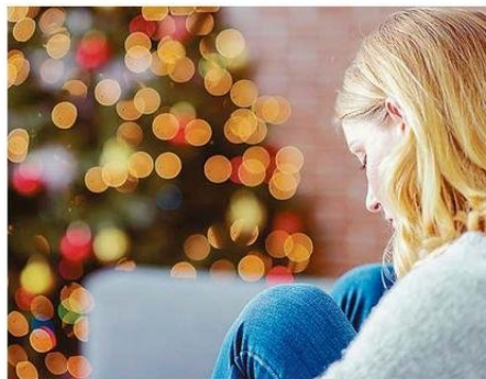
BRINDAR COMPAÑÍA A QUIEN VIVE UN DUELO POR ESTAS FECHAS.

Muñoz aboga por rituales: “Ayudan a sostenernos. Prender una velita. El escribir una carta, decir