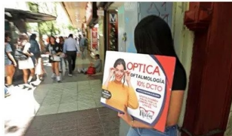
Muchas de las ópticas tienen también en las calles los llamados "captadores" de clientes, que con grandes letreros suelen abordar a los transeúntes de Mac-Iver, Ahumada o alguna galería comercial.

Y es que con más de 650 ópticas en solo pocas cuadras, es difícil encontrar una explicación de clientes, que con grandes letreros suelen abordar a los transeúntes que caminan por Mac-Iver, Ahumada o alguna galería comercial—, y que la mayor parte del tiempo pasan vacíos. ¿Cuál es la justificación para esta insólita proliferación? ¿Al otorgarse los permisos municipales a nadie le ha llamado