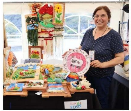
LOS EMPRENDEDORES LOCALES SE DARÁN A CONOCER EN TODO EL PAÍS.