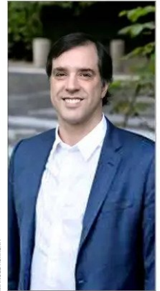
Ignacio Yarur Arrasate, futuro presidente de Bci.