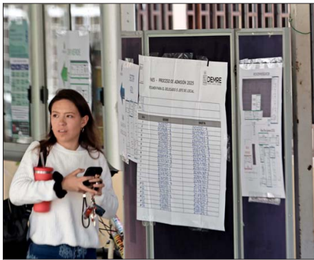
EXAMEN. — Más de 294 mil inscritos tiene la PAES, que hoy culmina. Los resultados se conocerán el 6 de enero.

Para acceder a los distintos beneficios, los postulantes deben inscribirse en el Formulario Único de Acreditación Socioeconómica (FUAS).