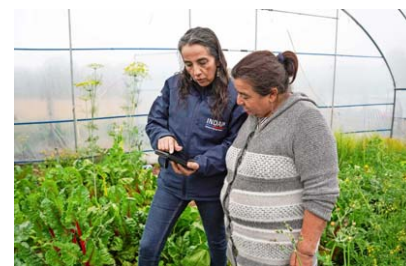
Cada vez son más los usuarios que aprenden y se suman a las opciones crediticias.