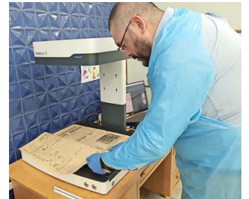
Proceso de digitalización de los ejemplares originales de "La Patria".