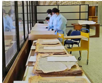
Proceso de revisión y limpieza de cada uno de los números digitalizados.

Los avances fueron posibles gracias a las 40 mil libras esterlinas que se adjudicó Bibliotecas UdeC como parte del Endangered Archives Programme que promueve la British Library. Entre otras acciones, el proyecto incluyó la realización de capacitaciones, encuentros y talleres.