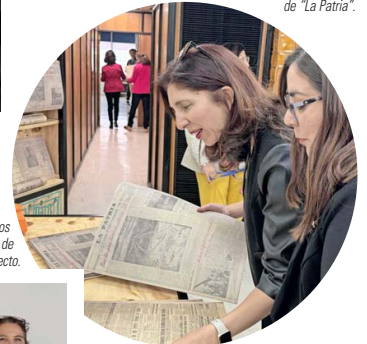
Reproducciones entregadas a los asistentes durante la actividad de cierre del proyecto.