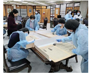
Taller de limpieza mecánica y conservación preventiva, realizado por la Unidad de Patrimonio Bibliográfico de la Universidad de Concepción al equipo del proyecto.