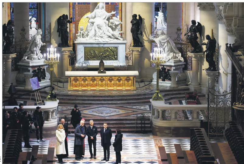
El presidente Macron y su esposa Brigitte quedaron impresionados y conmovidos con la delicadeza de los trabajos.