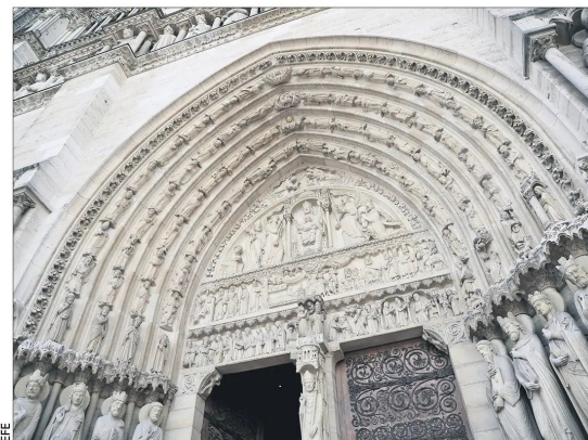
Un detalle del arte gótico de la catedral.