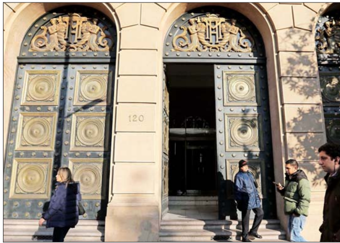
Las estadísticas de Dipres muestran que el sobrecosto del endeudamiento seguirá creciendo hasta el año 2028.

Se estima que en 2024 estos desembolsos superarán los US$ 3.700 millones. En el tercer trimestre este tipo de pagos se aceleró y sumó a US$ 1.286 millones. Analistas alertan por cifras.