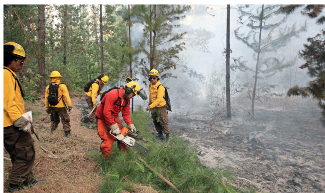
Mantener los terrenos limpios en los primeros dos metros desde la base es primordial para prevenir incendios forestales.

"Hoy contamos con un sistema integrado donde todos somos parte: sector público, privado y comunidad. Esto permite coordinar esfuerzos en