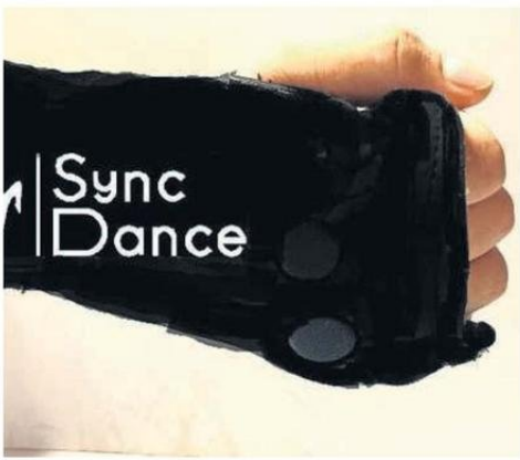
"Sync Dance", proyecto del Maule, ayuda a bailar a personas ciegas.

trabajo en equipo, la comunicación efectiva y la resolución de problemas", destacó.