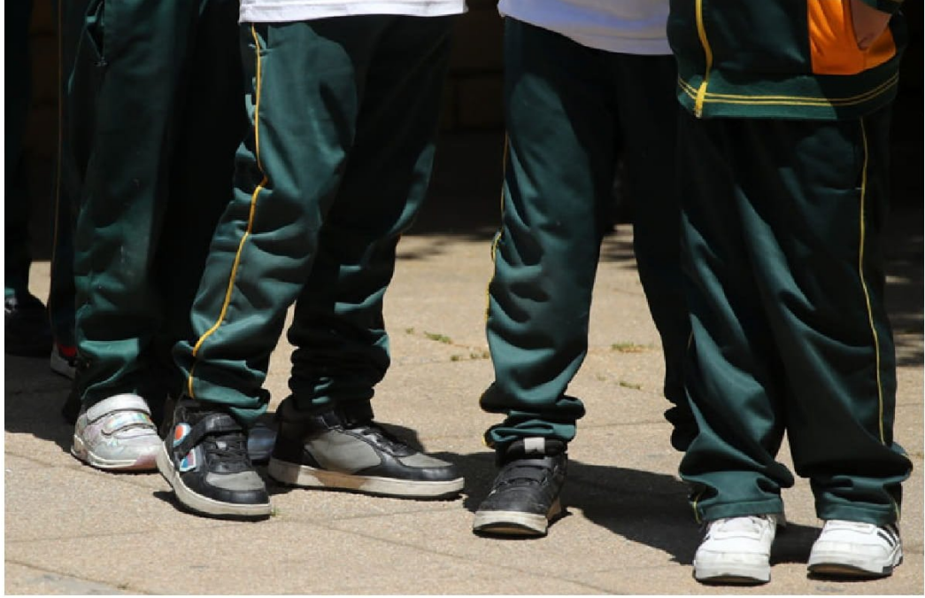
► En la Región Metropolitana se han concentrado 82 homicidios de menores entre 2022 y noviembre de 2024.