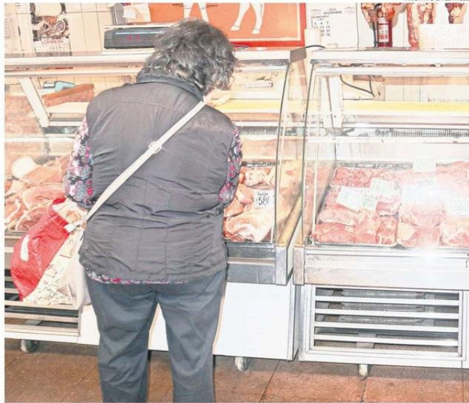
LAS ALZAS DE ALIMENTOS, SERVICIOS Y OTROS IMPACTAN EN EL PRESUPUESTO DE LAS FAMILIAS.

La especialista subrayó que “en Biobío, los hogares enfrentan un fuerte impacto en su presupuesto mensual por el alza en alimentos, vivienda y transporte. Los precios de alimentos básicos como carnes y frutas han registrado significativos aumentos, mientras que las tarifas eléctricas, descon-