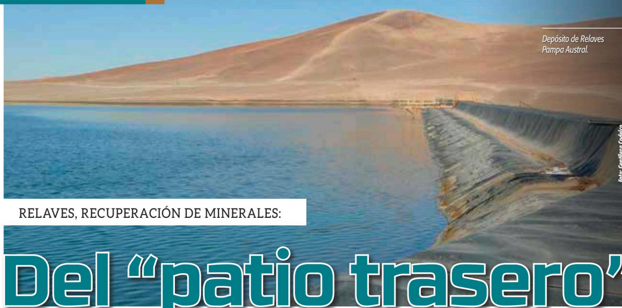
Depósito de Relaves Pampa Austral.