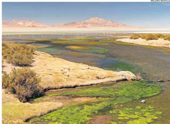
EL SALAR DE ASCOTÁN, UBICADO EN OLLAGÜE, ES UNO DE LAS ZONAS DONDE SE EXPLORARÍA Y EXPLOTARÍA LITIO.