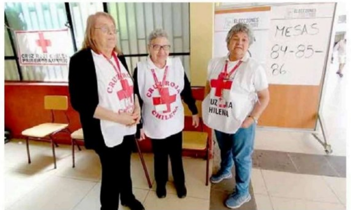
Voluntarias de la Cruz Roja, estuvieron durante la jornada en el Liceo Fernando Lazcano de Curicó.