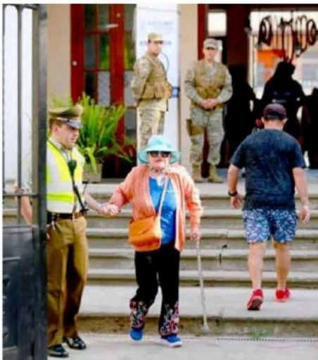
Carabineros apoyando en los recintos para facilitar el acceso a los locales de votación.