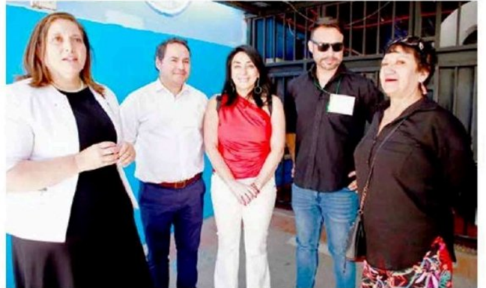
Senadora Paulina Vodanovic votó en la Escuela Carlos Salinas Lagos de Talca y estuvo acompañada de Cristina Bravo.