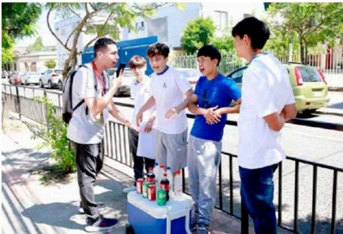
Alumnos de colegios aprovecharon de generar recursos pensando en sus giras estudiantiles.