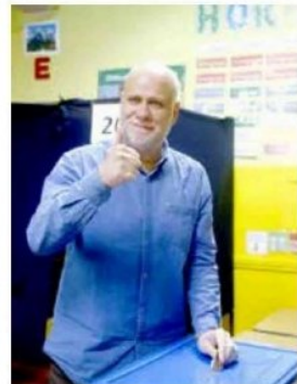
Álvaro Elizalde, ministro secretario general de la Presidencia, votó en Talca.