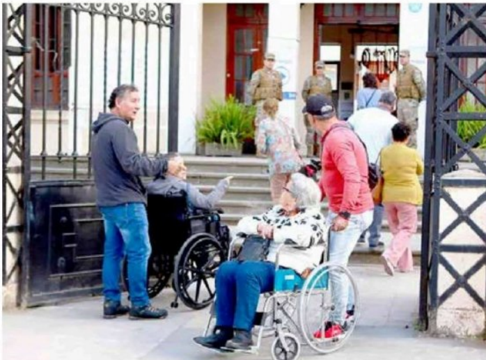
Electoras siendo asistidas en el ingreso a sus recintos de votación.