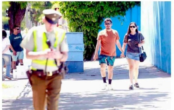
Ropa liviana para disminuir los efectos de las altas temperaturas.