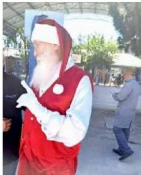
El Viejito Pascuero estuvo recorriendo Curicó y aprovechó de ejercer su derecho a voto.