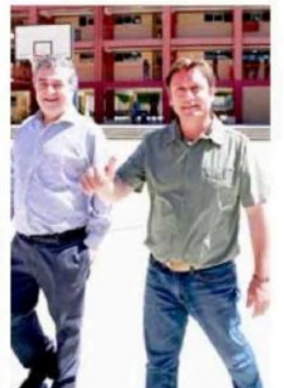
Pedro Álvarez-Salamanca acompañó a votar al senador Juan Antonio Coloma.

TALCA/CURICÓ. La rápida constitución de las mesas, el tiempo de votación considerablemente menor a la elección del 26 y 27 de octubre y el acceso expedito a los distintos locales de votación, fueron las principales características de la segunda vuelta electoral realizada en la jornada de ayer.