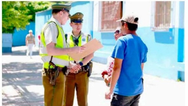
Carabineros recibiendo consultas.