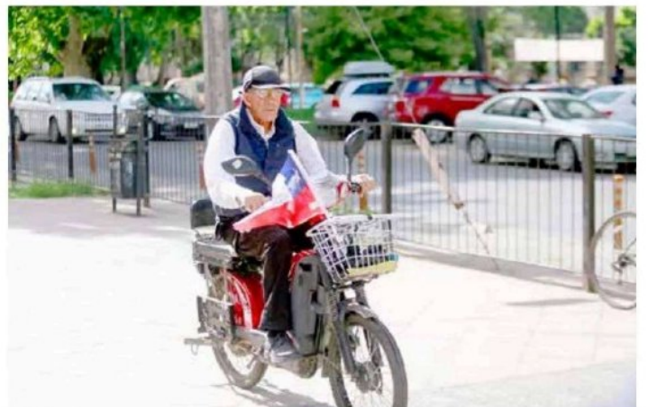
Cualquier medio era válido para llegar a cumplir con el deber cívico.