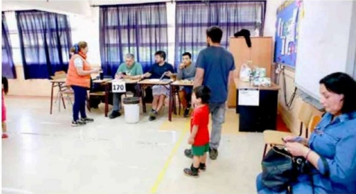
Mesas despejadas y sin aglomeraciones fue la característica de la jornada.