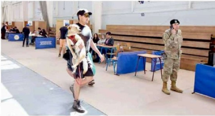
Algunas personas llegaron a votar acompañadas de su mascota.