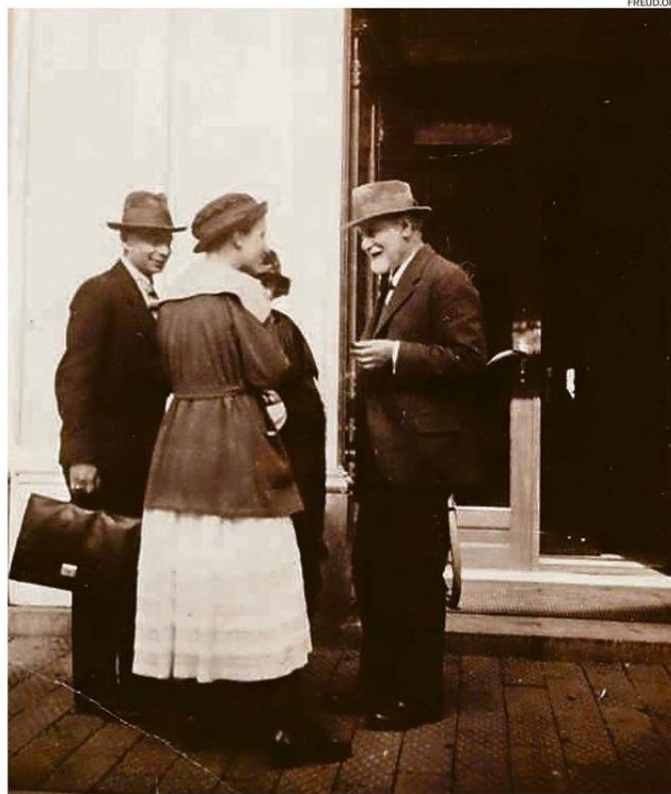
RANK FUE UN DISCÍPULO MUY CERCANO A FREUD, DE QUIEN SE TERMINÓ DISTANCIANDO.