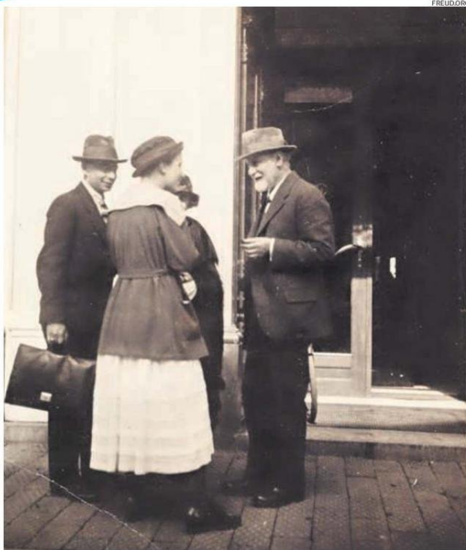
RANK FUE UN DISCÍPULO MUY CERCANO A FREUD, DE QUIEN SE TERMINÓ DISTANCIANDO.