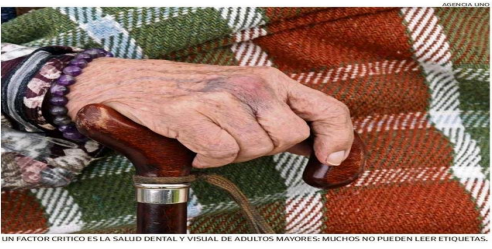
UN FACTOR CRÍTICO ES LA SALUD DENTAL Y VISUAL DE ADULTOS MAYORES; MUCHOS NO PUEDEN LEER ETIQUETAS.

guen los lácteos (57,9%) y las legumbres (57,3%). Esto se ve también en el indicador que define qué alimentos son los que dominan en la dieta de los adultos mayores. El 30,3% expone que las legumbres son consumidas habitualmente y el 88,5% responde lo mismo respecto de los huevos. El 5,9% de los encuestados señaló haber pasado un día completo sin comer por falta de recursos. Desde el INTA señalaron que "los hallazgos de este estudio también demuestran que la inseguridad alimentaria es un determinante de la salud física, nutricional y mental de las personas mayores". El factor de inseguridad ali-