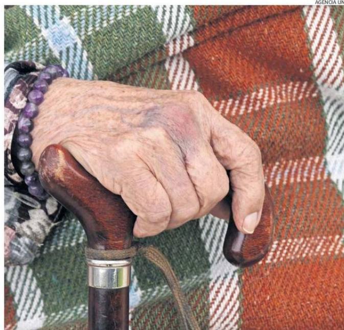
UN FACTOR CRÍTICO ES LA SALUD DENTAL Y VISUAL DE ADULTOS MAYORES: MUCHOS NO PUEDEN LEER ETIQUETAS.

mentaria se refiere a "la disponibilidad limitada o incierta de alimentos por factores sociodemográficos, ingreso económico, conocimientos y habilidades nutricionales, cercanía con lugares de abastecimiento, red de apoyo y otros".