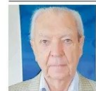
SERGIO MOLINA SILVA Exministro de los gobiernos de Frei Montalva, Aylwin y Frei Ruiz-Tagle

directora del Centro de Investigación Avanzada en Educación y miembro de la International Academy of Education.