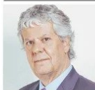
NICOLÁS EYZAGUIRRE GUZMÁN Fue ministro de Hacienda y Educación, gerente y

2016. Con una destacada trayectoria en banca mayorista y comercial, también ha liderado directorios financieros.