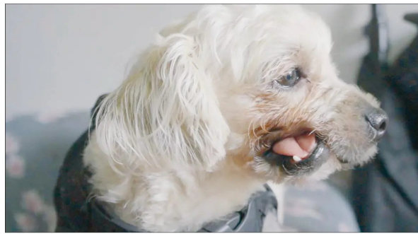
Así lucía antes de la intervención.

iban a funcionar, y cómo y dónde ponerlos. Es hacer un modelado previo".