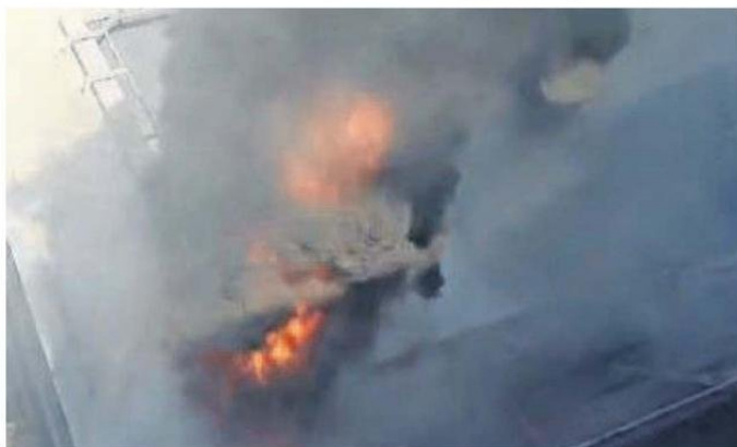
EL INCENDIO INICIÓ CUANDO SE HACÍA MANTENCIÓN DEL SISTEMA DE ENFRIAMIENTO.