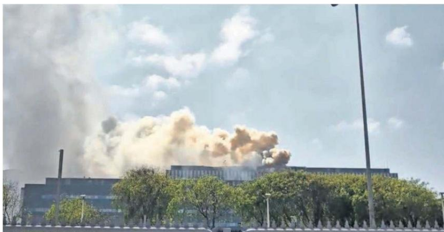
CERCA DE LAS 11 DE LA MAÑANA COMENZÓ EL INCENDIO EN EL CUARTO PISO DEL HOSPITAL REGIONAL DE ANTOFAGASTA.

Además, el reingreso controlado de pacientes y personal comenzó a las 12:16, priorizando la read-