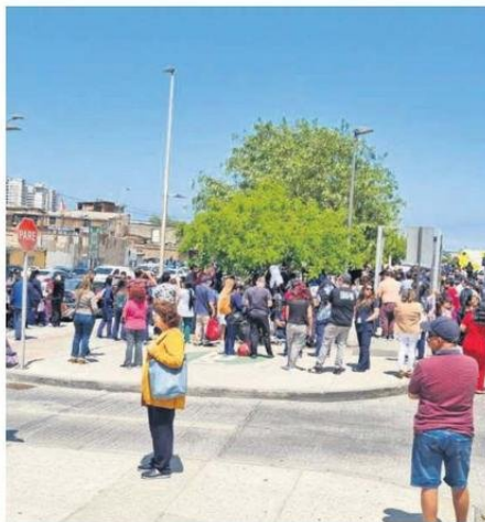
LA EMERGENCIA OBLIGÓ A EVACUAR A 2.600 PERSONAS.