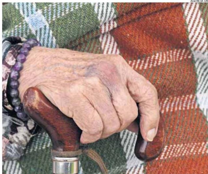
UN FACTOR CRÍTICO ES LA SALUD DENTAL Y VISUAL DE ADULTOS MAYORES: MUCHOS NO PUEDEN LEER ETIQUETAS.

El 5,6% de los encuestados señaló haber pasado un día