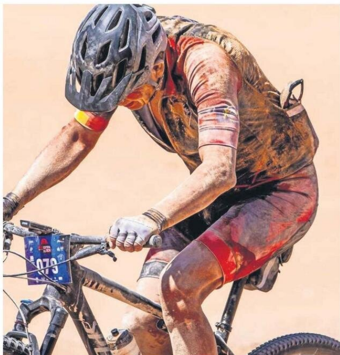
CICLISTAS "PRO" Y "AMATEURS" PODRÁN MEDIRSE EN CIRCUITOS DE 77 Y 32 KILÓMETROS.