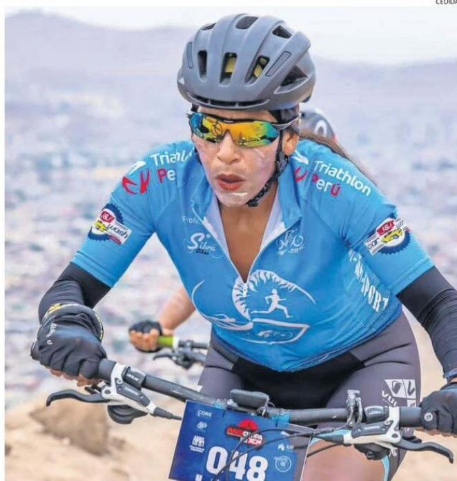
INSCRIPCIONES A LA CITA "XCM" SERÁN HASTA EL DÍA 25 DE NOVIEMBRE POR SPORT XV.