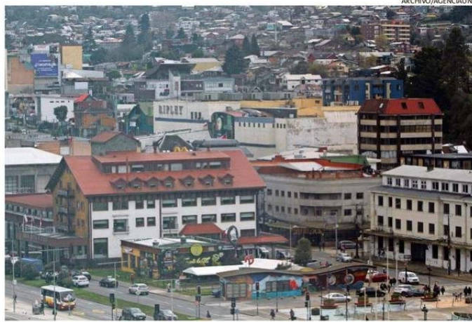
EXISTE COINCIDENCIA EN QUE TRAS ESTE RESULTADO, LA REGIÓN TIENE OPORTUNIDADES DE SEGUIR CRECIENDO.