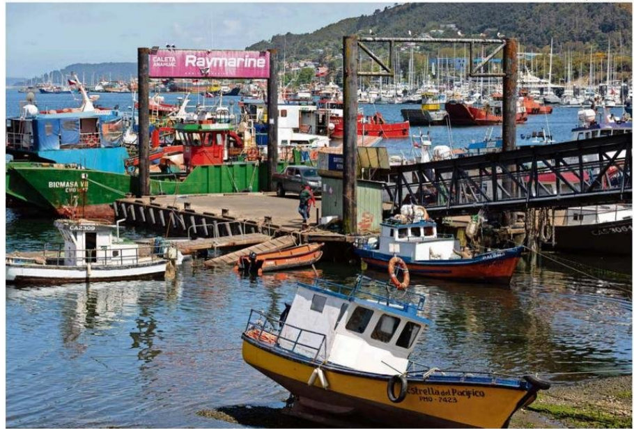
LA ACTIVIDAD DE LA INDUSTRIA ACUÍCOLA Y PESQUERA FUE RELEVANTE PARA ALCANZAR ESTE NIVEL DE DESARROLLO ECONÓMICO EN LOS LAGOS.