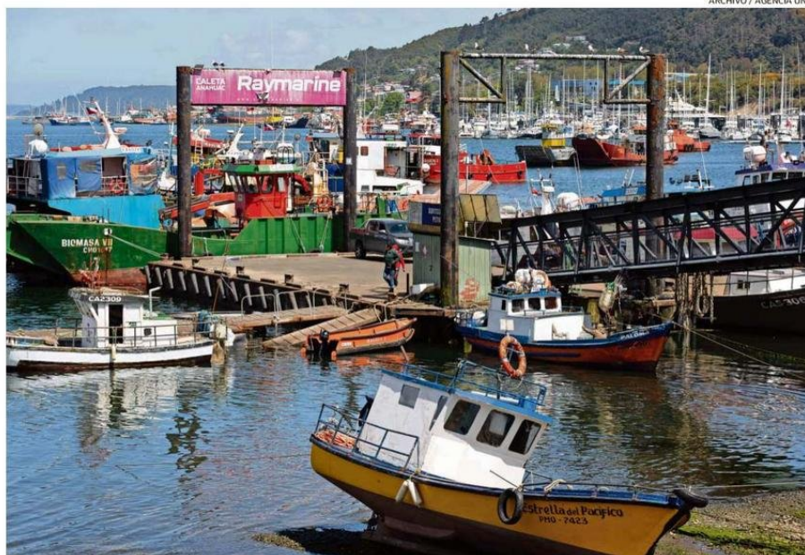
LA ACTIVIDAD DE LA INDUSTRIA ACUÍCOLA Y PESQUERA FUE RELEVANTE PARA ALCANZAR ESTE NIVEL DE DESARROLLO ECONÓMICO EN LOS LAGOS.

En segundo lugar están los servicios personales, como ac-