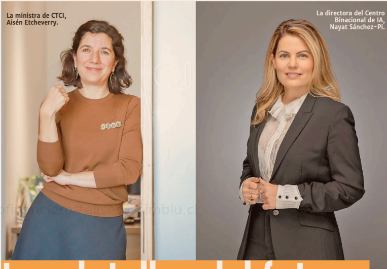
La ministra de CTCI, Aisén Etcheverry.

Etcheverry señaló que la nueva entidad permitirá establecer planes de investigación colaborativa y