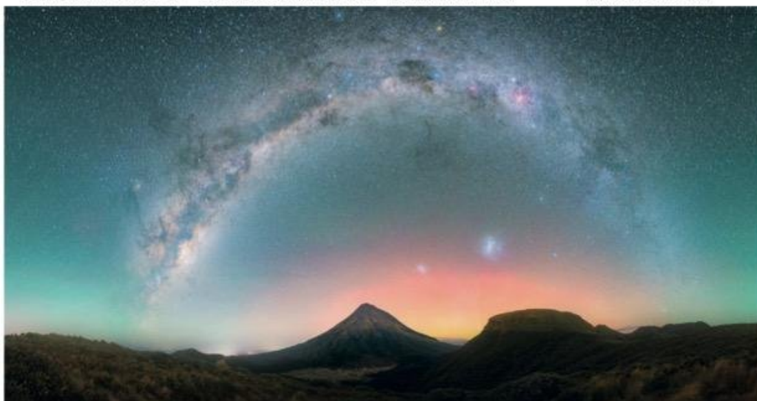
Bajo el arco de la Vía Láctea, el monte Taranaki de Nueva Zelanda se recorta contra el tenue resplandor de las auroras australes en el horizonte. El turismo de cielos oscuros está en alza, y Nueva Zelanda espera convertirse en una "nación de cielos oscuros" por su conservación de paisajes nocturnos prístinos.

Cada vez hay más pruebas de que la misma alquimia que sentimos en un santuario a cielo oscuro (una sensación de asombro al contemplar la inmensidad del cosmos) está aso-