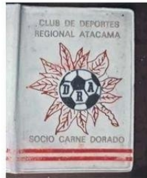
CARNE DE SOCIO DORADO.