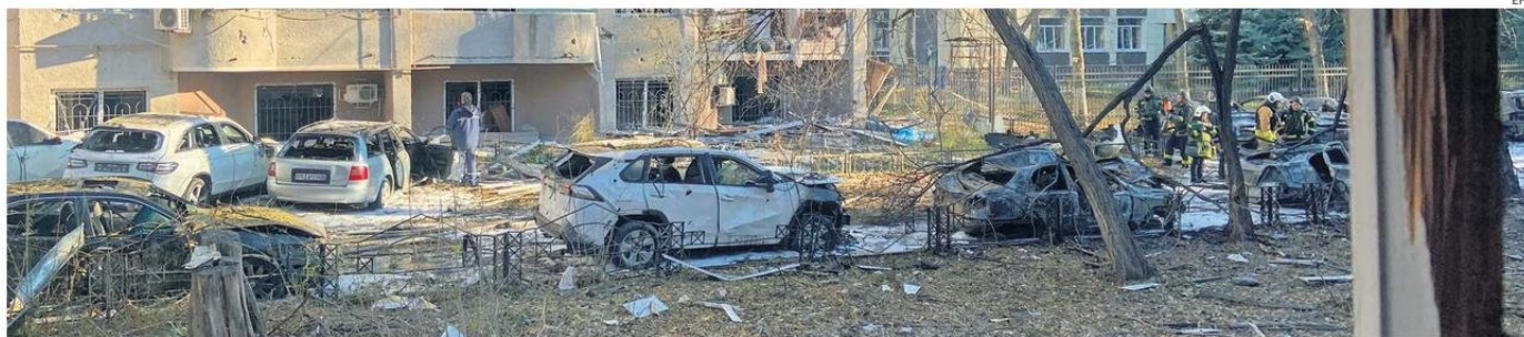
RESCATISTAS UCRANIANOS TRABAJAN EN EL LUGAR DE UN ATAQUE CON MISILES EN UNA ZONA RESIDENCIAL DE ODESA, EN EL SUROESTE DE UCRANIA.