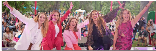
Financiamiento inclusivo, capacitación integral y redes de apoyo: los 3 ejes del petitorio de Fundadoras para potenciar el emprendimiento femenino. 14

ROOMMATE IDEAL: UNIVERSITARIA CREA PLATAFORMA CON IA QUE AYUDA A ENCONTRAR AL COMPAÑERO DE CASA MÁS IDÓNEO CON QUIÉN COMPATIR Y DIVIDIR LOS GASTOS. 16