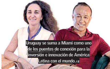
Uruguay se suma a Miami como uno de los puentes de conexión para la inversión e innovación de América Latina con el mundo. 12