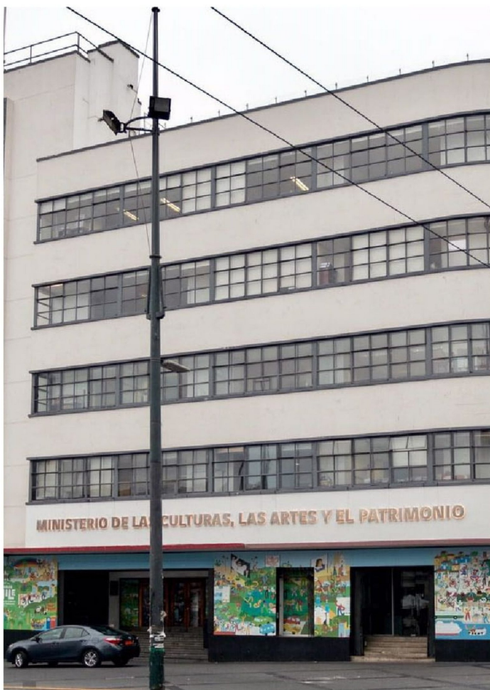
► El actual presupuesto de Cultura alcanza el 0,44% del total de la nación,

La incertidumbre, eso sí, persiste. "No tenemos apuestas de cuál será el resultado", cierra Rebolledo. ●