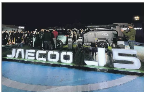
Arte de la multitudinaria presentación.