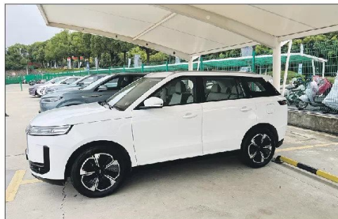
Nuevop Jaecoo J7