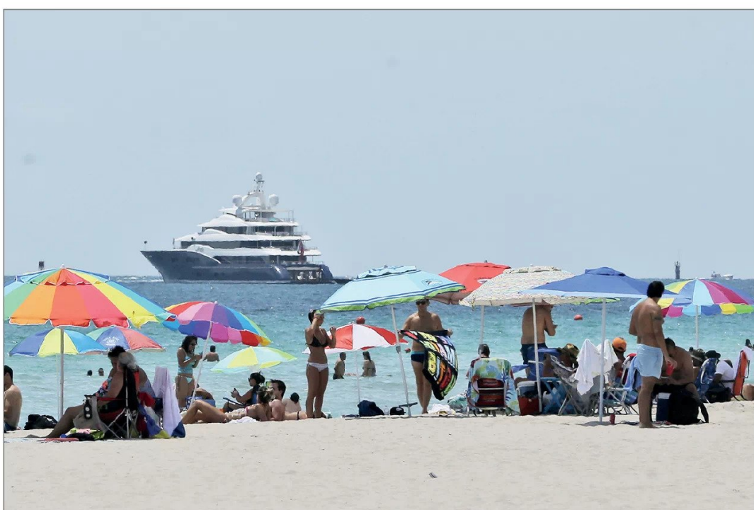
Un punto a favor de South Beach es su fácil acceso desde cualquier punto de la ciudad.

Platos de primera. - La oferta culinaria de Miami es tan diversa como la propia ciudad, reflejando influencias de América Latina, el Caribe y Europa. Uno de los imperdibles es el icónico restaurante Gianni's, ubicado en la antigua mansión de Versace, donde se puede cenar rodeado de lujo e historia, y por supuesto, hacerse varias fotos.