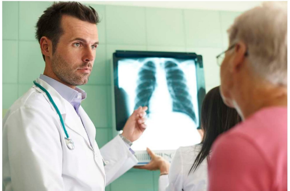
DETECTAR UN CÁNCER DE PULMÓN EN ETAPA PRECOZ permitirá una sobrevida del paciente de alrededor del 90% a cinco años.

Además, no solo los fumadores activos están en peligro. Los fumadores pasivos, es decir, quienes respiran el humo del tabaco de otros, también tienen un mayor riesgo de desarrollar esta enfermedad en comparación con quienes