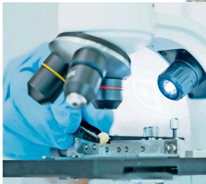
ESTUDIO PODRÍA AYUDAR A ENTENDER CÓMO LAS CÉLULAS CANCEROSAS DESARROLLAN RESISTENCIA.

Uno de los hallazgos clave es el requisito de “separación a escala de tiempo” en el comportamiento de los circuitos moleculares, donde algunas