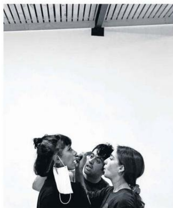
La confusión, el olvido y la rabia son puestos en escena de una manera simbólica.

- En este caso, a partir de un sentir inspirado en un lenguaje fílmico, se plantean distintos escenarios que son parte del montaje y que, además, sirven de conectores narrativos en la experiencia del escenario. De este modo, la sensibilidad y la emotividad resultan clave al momento de plasmar, memorias, recuerdos, texturas y realidades.