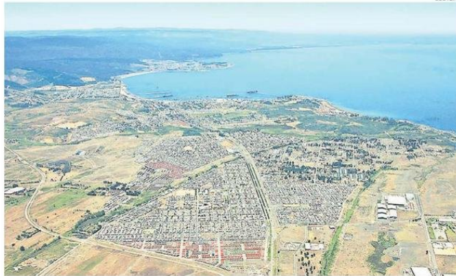
LA COMUNA ES UNA DE LAS MÁS COMPLEJAS CON LA PROBLEMÁTICA EN MATERIA DE ESCASEZ HÍDRICA.

Al ser consultado sobre cómo se confirma la presencia de la mano del hombre en este problema, el experto indicó que “si bien, el hierro total y manganeso total se encuentran de forma natural en el acuífero, hay otro factor en el cual se adicionan ya estos metales por actividad industrial. La zona sur del acuífero Coronel está bajo una zona altamente industrial (...) en momentos, por ejemplo, de lluvia, ésta es ca-