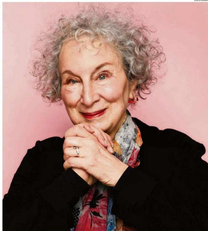
"CUANDO UN MOMENTO SUCEDE, YA ES PASADO", DICE ATWOOD.

-Lo leí bastante cuando era joven. "Rebelión en la granja" no tenía idea que era una alegoría política, pensaba que era una historia divertida para niños y después me fui horrorizando, poco a poco. Cuando matan al caballo me pareció bastante espantoso: ahí me di cuenta que evidentemente no era una novela para niños, me causó mucha impresión y después descubrí que era una alegoría. (...) También me interesaba muchísimo la pregunta ¿cómo sería Inglaterra si fuera una dictadura? Es la misma que hice sobre Estados Unidos cuando escribí "El cuento de la criada", porque me comenzaron a interesar (como tópico narrativo) las formas totalitarias de Gobierno, ese ambiente.