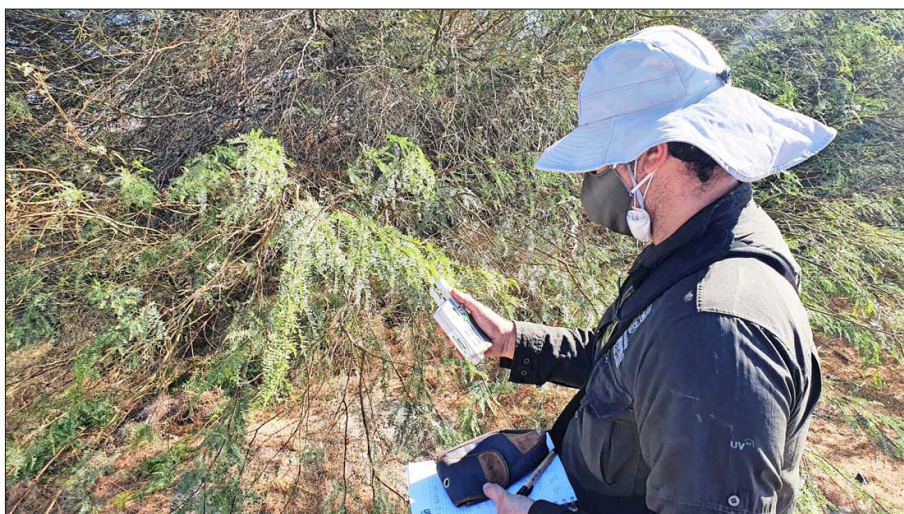
Para la investigación se han recolectado muestras, principalmente hojas, de árboles y plantas como chañar, algarrobo y tamarugo, entre otras especies emblemáticas de la zona.

Neltuma alba (algarrobo blanco), Neltuma chilensis (algarrobo chileno), Strombocarpa strombulifera (retortón fortuna) y Strombocarpa tamarugo (tamarugo) son algunos de los pocos árboles y arbustos resistentes a la sequía que se encuentran en pequeñas poblaciones, muy fragmen-