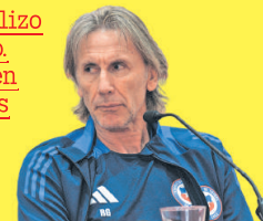
RICARDO GARECA DT de la Selección Pág. 11

"En estos momentos no analizo ningún escenario negativo. Estoy positivo, estamos bien y lo único que contemplo es la posibilidad de ganar".