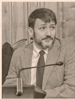
DIEGO PARDOW, MINISTRO DE ENERGÍA.

De existir excedentes, "la porción de que corresponda a los aportes fiscales (...) no será enterada al