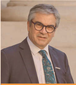
MARIO MARCEL, MINISTRO DE HACIENDA.

■ “Con esta ratificación, que se suma a la de otras clasificadoras, se observa que el manejo económico y fiscal para restablecer los equilibrios macroeconómicos ha dado resultado”, dijo el ministro de Hacienda.