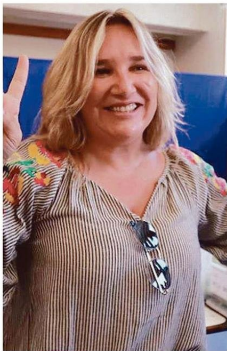
ESTA SEMANA ES LA RECTA FINAL DE LA CAMPAÑA DE SEGUNDA VUELTA DE LA ELECCIÓN DE GOBERNADOR/A REGIONAL

Rodrigo Mundaca, por su parte, señala que los principales ejes de su campaña, han sido seguir informando a la ciudadanía todo lo que viene como resultado de su gestión y sumar urgencias a temas super desafiantes que han tenido avances y